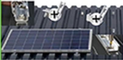
KITS DE ESTRUCTURAS Y FIJACIONES PARA...